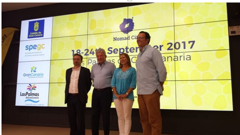
Imagen de archivo